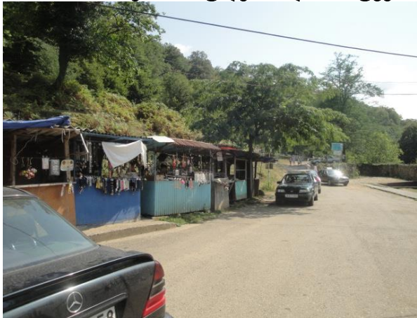
გამოსახულება 1 და 2: სუვენირების ჯიხურები პროექტის ზონაში

ამას გარდა ერთი ჯიხური მდებარეობს ცივი სასმელების სავაჭრო ტერიტორიაზე ( სურათი 3) ხოლო ტირი პროექტის ხაზის მიმდებარედ ( გამოსახულება 4)