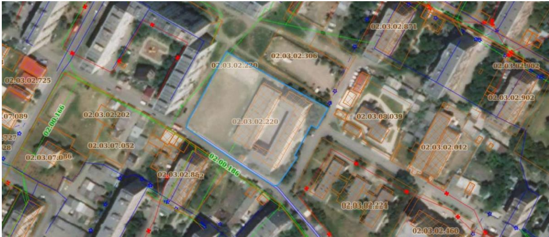
დანართი 1: ორთო-ფოტო