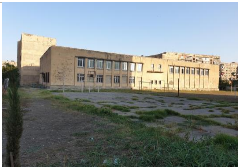
დანართი 6: ობიექტის ფოტოები