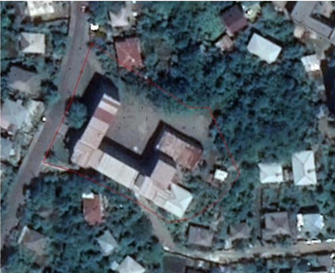
დანართი 1: ორთოფოტო