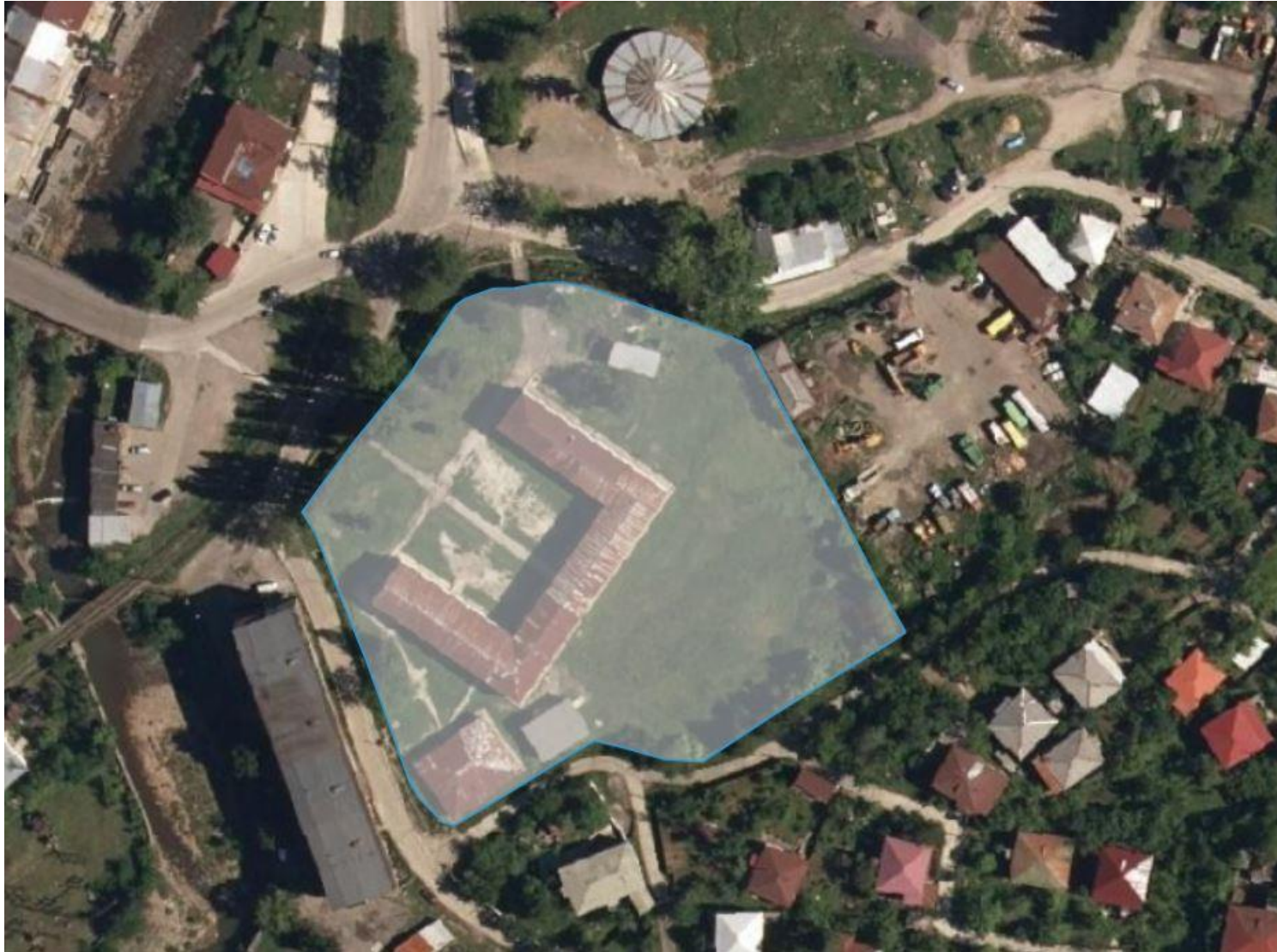
დანართი 1: ორთოფოტო