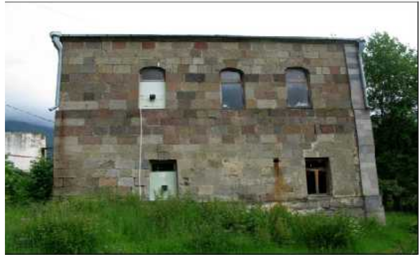
ჩრდილოეთი ფასადი / North Facade