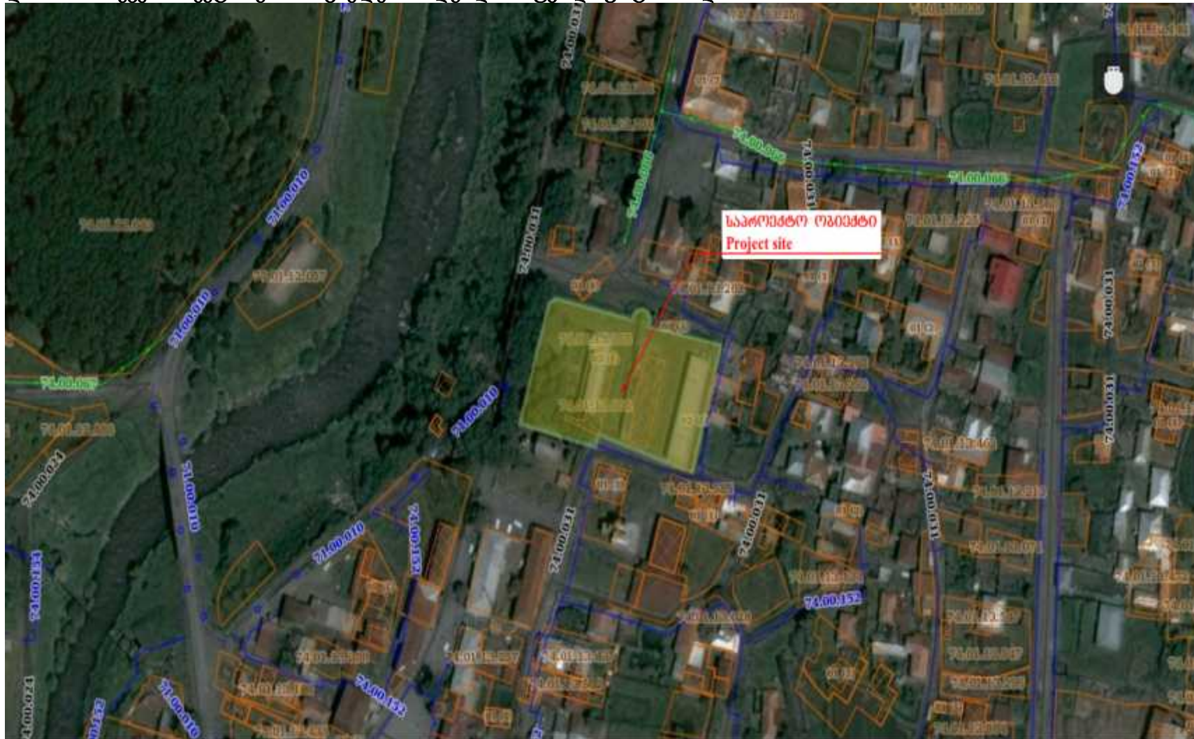
დანართი 1. ქვე-პროექტის განხორციელების ადგილის რუკა და ფოტომასალა