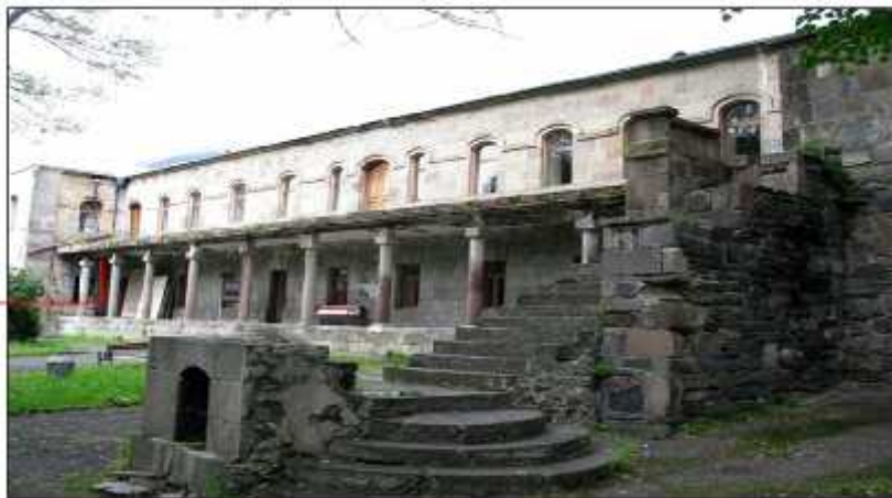
დასავლეთი ფასადი / West Facade