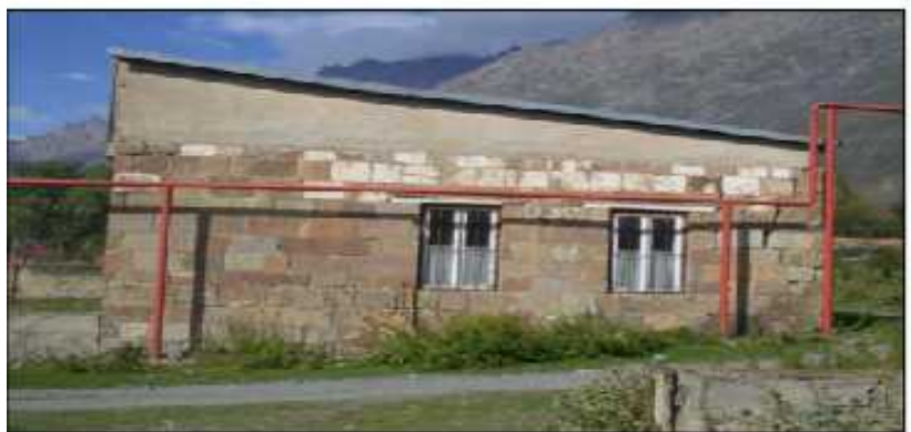
კახსნიკეთი ფასადი / South Facade