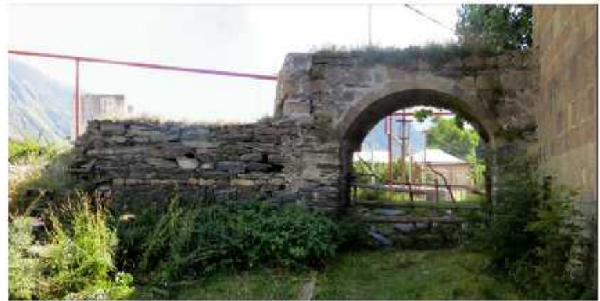
ჩრდილოეთი ფასადი / North Facade