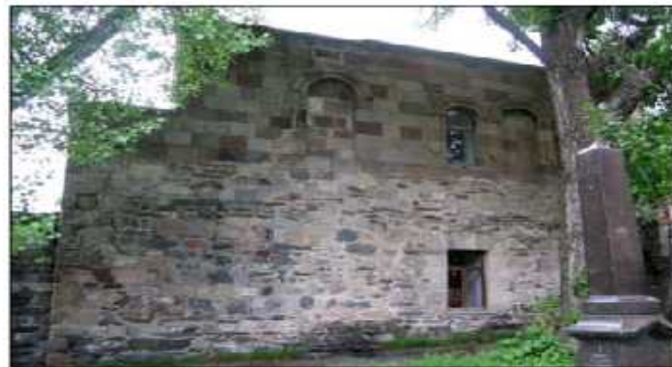
სამხრეთი ფასადი / South Facade