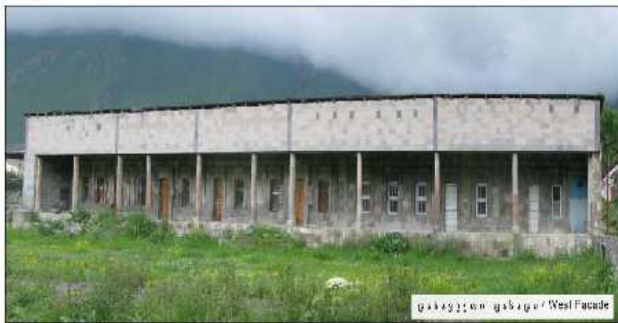
დასავლეთი ფასადი / West Facade