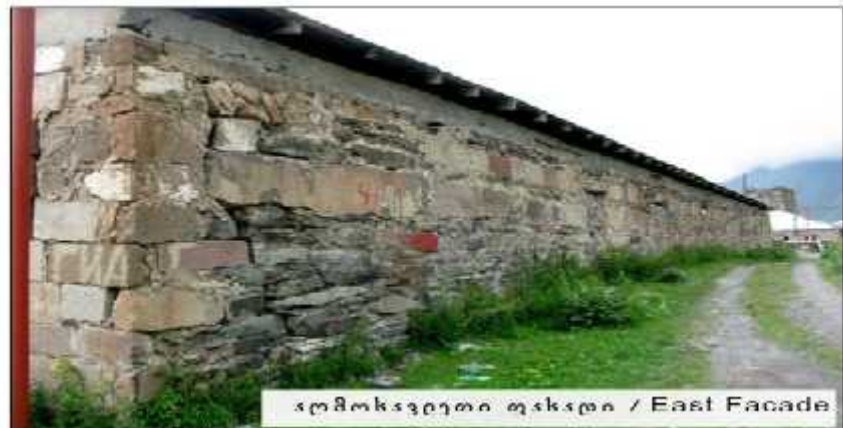
აღმოსავლეთი ფასადი / East Facade