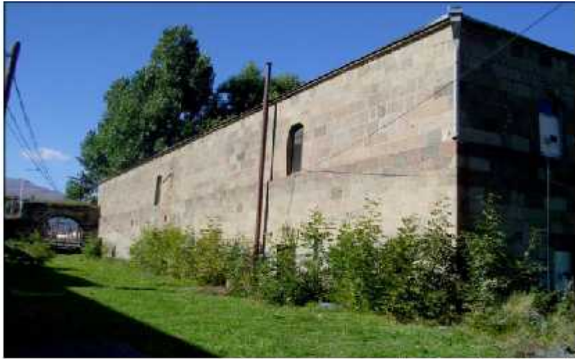
აღმოსავლეთი ფასადი / East Facade