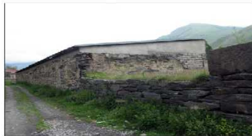
ჩრდილოეთი ფასადი / North Facade